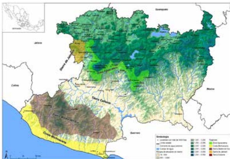
Mapa 5. Zonas de Michoacán