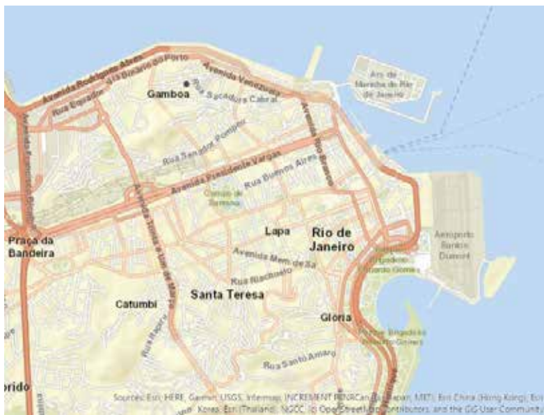
Mapa 1. Zona centro de Río de Janeiro