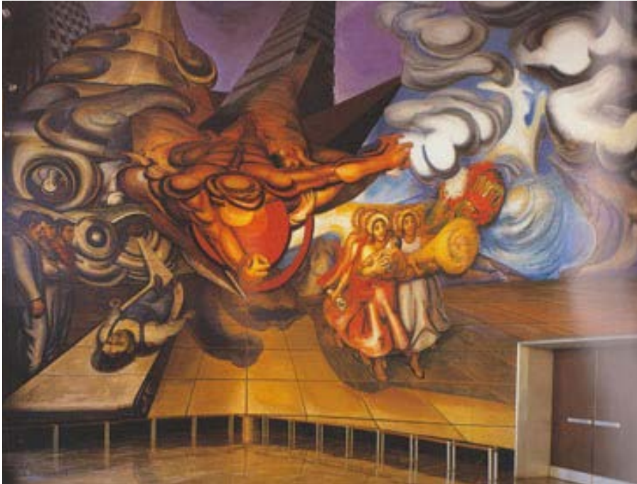
5. David Alfaro Siqueiros, Por seguridad social y completa para todos los mexicanos , 1954. Ciudad de México, Centro Médico Nacional La Raza. D.R.© David Alfaro Siqueiros/SOMAAP/México/2014. “Reproducción autorizada por el Instituto Nacional de Bellas Artes y Literatura.”

A la izquierda está el cuerpo del obrero muerto por la máquina, con una arquitectura fantástica; a la derecha, unas mujeres, una con un niño en los brazos y otra con un haz de trigo, obreros, médicos con una bandera. En el cielo, un Prometeo incendiado.