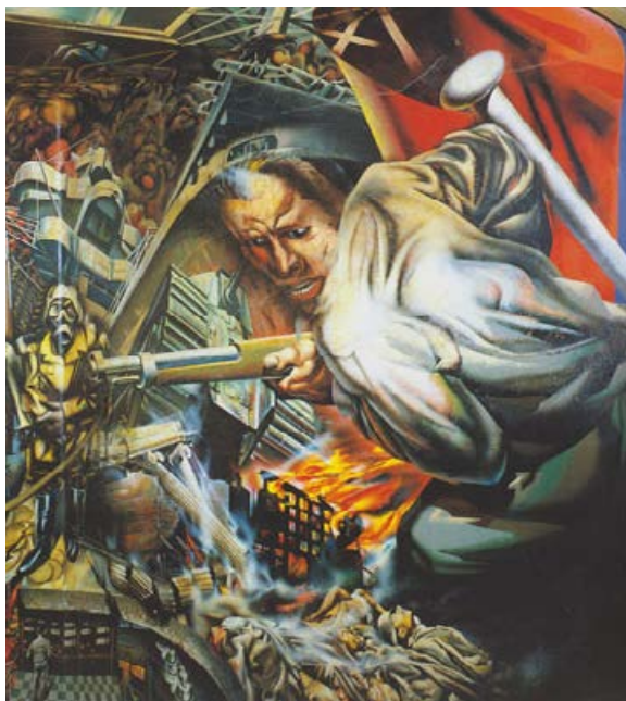
3. David Alfaro Siqueiros, Retrato de la burguesía, 1939. Ciudad de México, Sindicato Mexicano de Electricistas.