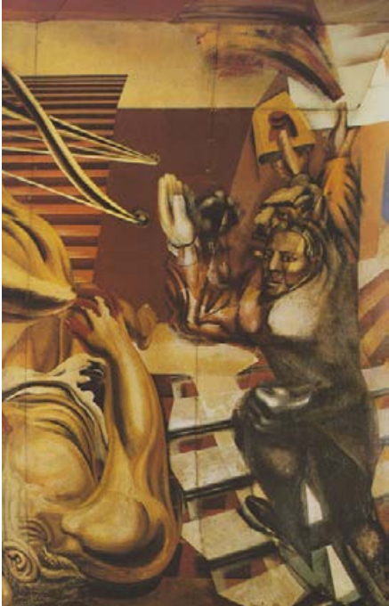
4. David Alfaro Siqueiros, Muerte al invasor, 1941-1942. Chillán, Chile, Escuela México.

emblemática, la libertad, una mujer con el torso desnudo, con el gorro frigio, con cadenas, proyectándose hacia el espectador desde el fondo junto con un brazo y un puño, es de lo mejor de la pintura de Siqueiros. Asimismo los dos tableros, Víctimas de la guerra y Víctimas del fascismo , son escorzos formidables.