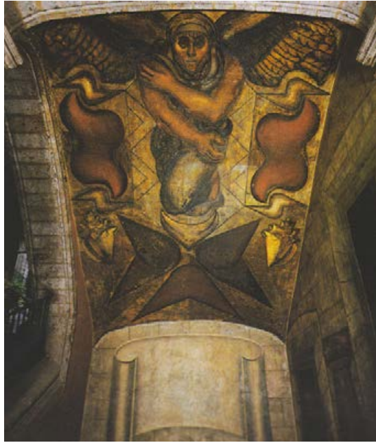
1. David Alfaro Siqueiros, Los elementos , 1922-1923. Ciudad de México, escalera del patio chico del Antiguo Colegio de San Ildefonso. D.R.© David Alfaro Siqueiros/ SOMAAP/México/2014. “Reproducción autorizada por el Instituto Nacional de Bellas Artes y Literatura.”